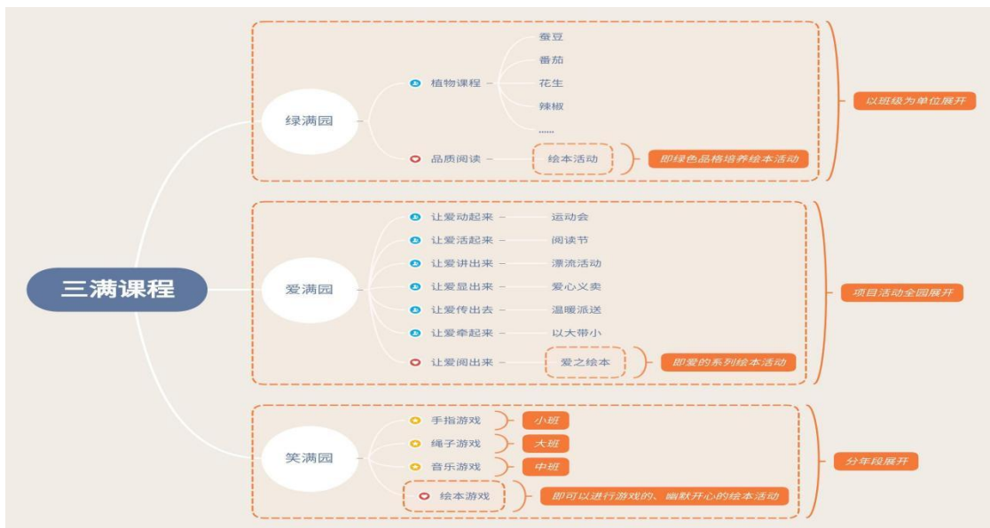
图 2：“悦读*阅爱”特色 1·5 课程架构图